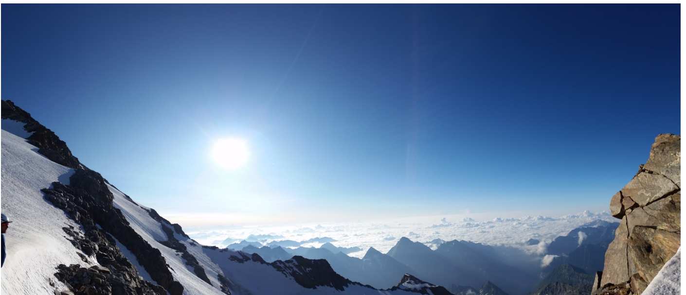
La vue au col en direction de la Punta Giordani

Nous redescendons après peu de temps car le vent se lève sévèrement et nous devons prendre les télécabines avant midi. Les trois cordées se suivent, jusque dans les crevasses ! Certains auront goûté à l'adrénaline provoquée par la chute (d'une jambe, ou jusqu'à mi-corps) dans une crevasse ! La descente est délicate jusqu'au col. Il ne faut pas faire d'erreurs afin d'éviter des chutes plus dangereuses, mais après ce col, elle se termine à un bon rythme et facilement jusqu'au campement que nous avons laissé ! Il est environ 10h lorsque nous sommes arrivés ! Les nuages montent progressivement, il est l'heure de prendre nos sacs pour redescendre à Gressoney, la tête remplie d'émotions intenses, de paysages grandioses, et de sensations uniques.