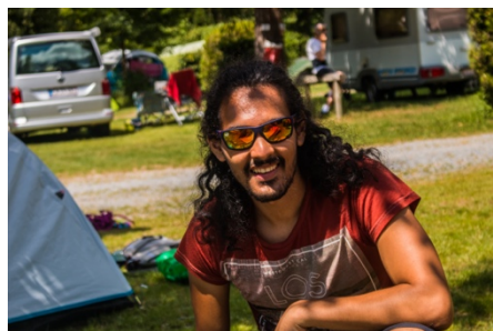
Ayoub, le photographe